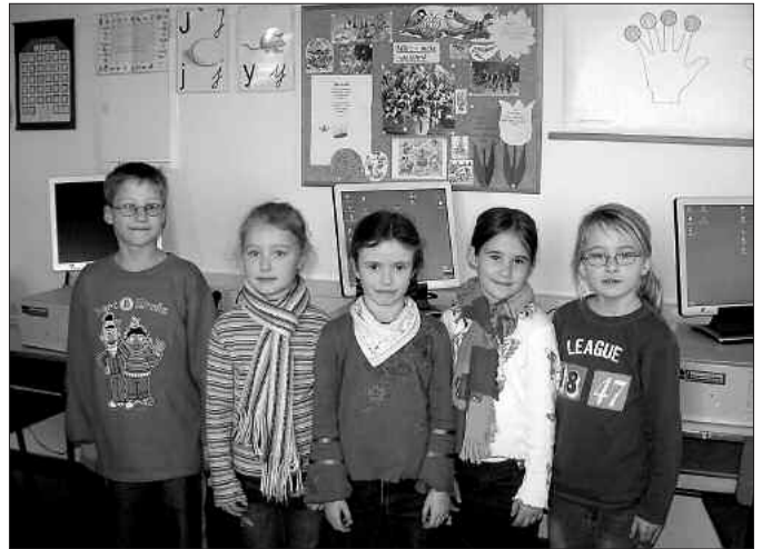
Die Sprachkinder der Klasse 1 der GS Baruth

Viel Freude bereitet es uns auch, wenn wir erlernte Lieder und Tänze in Programmen darbieten können. Meistens dürfen wir dann auch die sorbische Tracht tragen. Darauf sind wir besonders stolz.