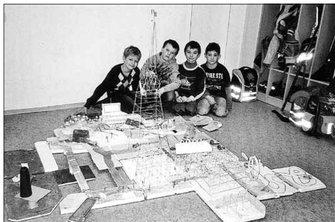
Hort der Kindervereinigung e. V. Guttau

Dieses Projekt - doch wir sind sicher, es folgen viele weitere.