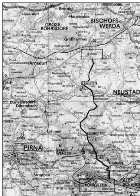
Karte 03: von Bühlau nach Königstein

Oberhalb unseres Weges verlief eine Straße, auf der die Wehrmacht entlang zog. Autos, Geschütze und anderes militärisches Zeug, was sie scheinbar nicht mehr benötigten oder aufgrund Spritmangel ihrer Flucht hinderlich waren, wurde einfach den Hang hinuntergestoßen oder gesprengt.