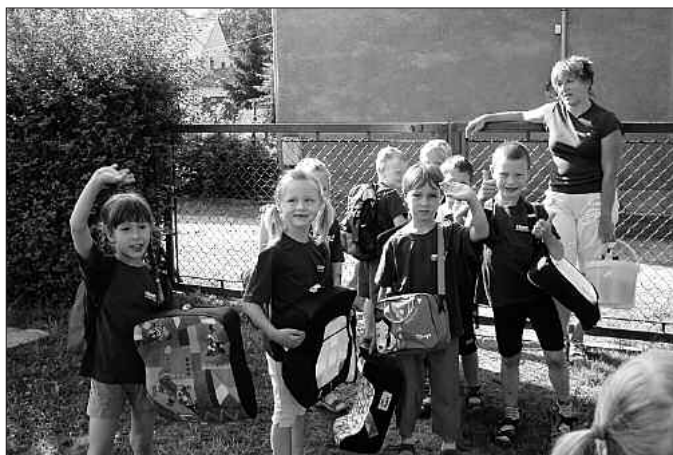
Die glücklichen Gewinner

dann 3. .... 2. .... 1. Platz - Kinderhaus Gutta