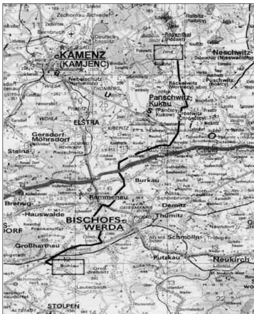
Karte 02: von Zerna nach Bühlau