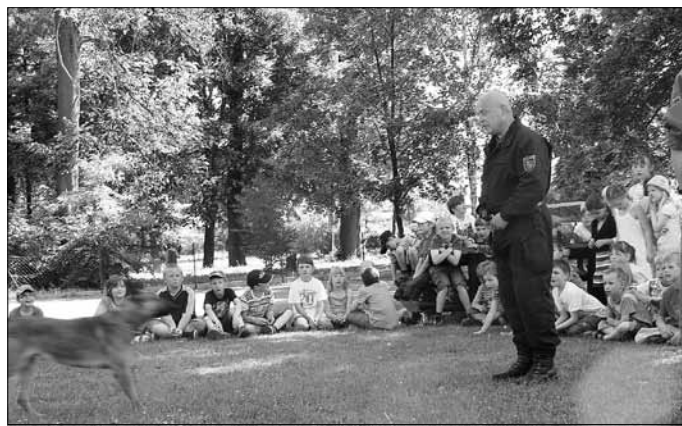
Schüler und Lehrer der Grundschule Baruth

Nachdem alle Stationen absolviert waren, gab es in der Turnhalle einen lustigen Ausklang mit dem Riesen-Polizei-Maskottchen „POLDI“.