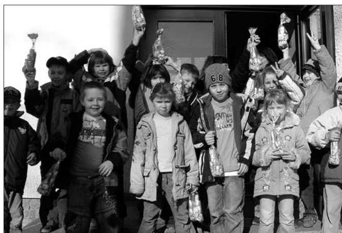
Schüler und Lehrer der GS Baruth

hatte mächtig viel zu tun in der Grundschule Baruth. Am letzten Schultag vor den Osterferien versteckte er für jedes Kind auf dem Schulhof eine kleine Überraschung. Davon merkten wir natürlich nichts, denn die Lehrer lenkten uns im Klassenzimmer geschickt mit „Bastelarbeiten“ ab. Doch dann kam der Startschuss für das große Suchen. Ein eisiger Wind wehte über den Schulhof und blies sogar ein paar Geschenke mit Laub zu. Letztendlich entdeckten wir nach langem Suchen doch noch alle Nester.