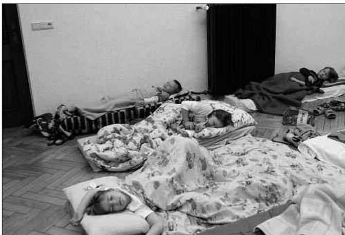
Schüler und Lehrer der Grundschule Baruth

Wir sind sehr froh, dass diese Angebote so gut von den Schülern und Eltern angenommen worden sind und weit über 80 % der Kinder etwas für sich finden konnten. Nach der ersten Woche können wir sagen: Schule mit Ganztagsangeboten ist eine gute Sache! Anfangsschwierigkeiten werden sich schnell regulieren.