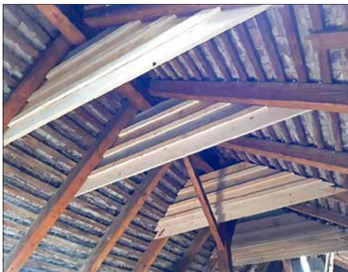
Eine der 5 angebrachten Großraumhöhlen