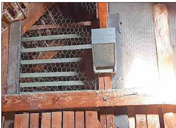
Spaltenquartiere vor dem Einzug der Zwischendecke

Durch den Einbau von hochwertigen Planen an einer Stahlseilkonstruktion wurden die Fledermaushangplätze räumlich vom übrigen Dachbodenbereich getrennt. Die Arbeiten wurden von der Baumdienst Knorre GmbH & Co. KG unter Mitwirkung von Artexperten durchgeführt. Die gesamte Maßnahme hatte einen Auftragswert von knapp 7.000 Euro.