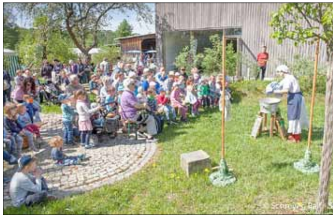
Puppenspiel „Auf uns'rer wiese gehet was“

Abgerundet hat das bunte Markttreiben eine Vielzahl an kulturellen Darbietungen, wie das Puppenspiel „Auf uns'rer Wiese gehet was“ vom Theater Klinger aus Görlitz, der traditionelle Tanz um den Maibaum und ein kleines Tanzprogramm der Nachwuchstanzgruppe des sorbischen Folkorens ensembles Wudwor e. V. Für große Kinderaugen und eine Menge Spaß sorgten darüber hinaus die Seifenblasenkünstler der Blubberey. Die Junior-Ranger des Biosphärenreservates mischten sich unter das Marktvolk und verteilten kleine Saatguttüten und machten damit auf das diesjährige Marktthema „Artenvielfalt auf dem Acker“ aufmerksam. Besucher konnten mehr über den Modellacker „Dubina“ am Hof der Biosphärenreservatsverwaltung sowie über Ackerwildkräuter und Blümmischungen erfahren.