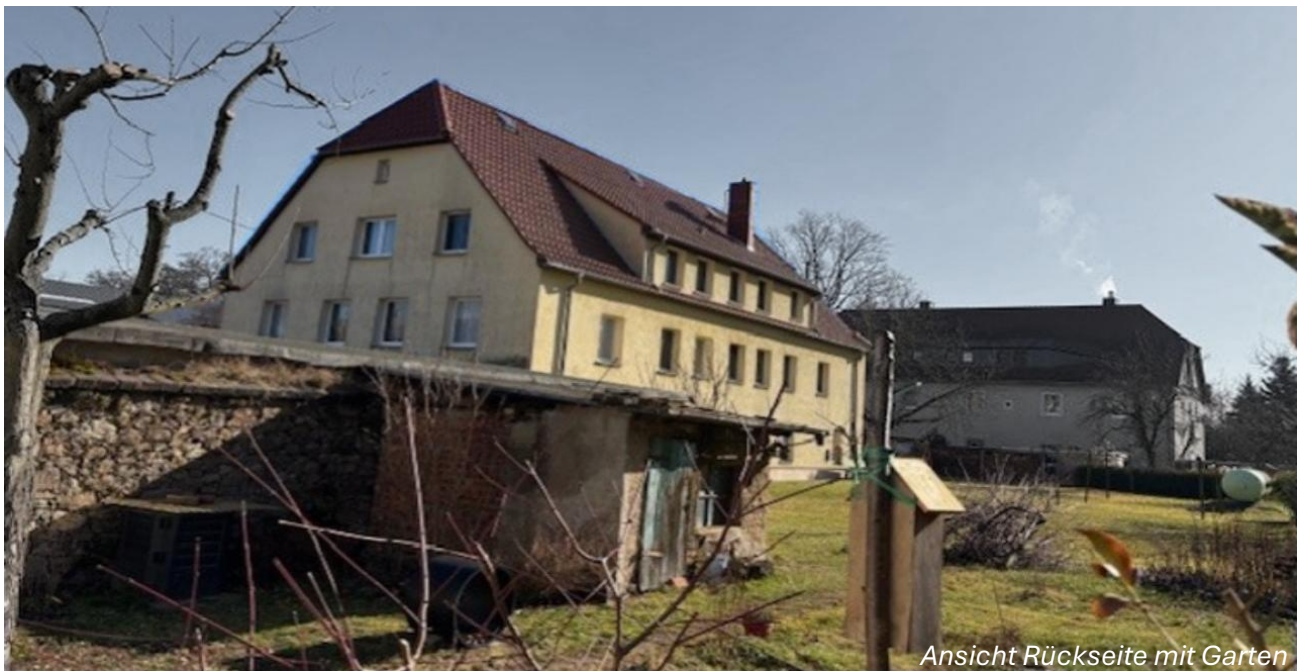
Ansicht Rückseite mit Garten