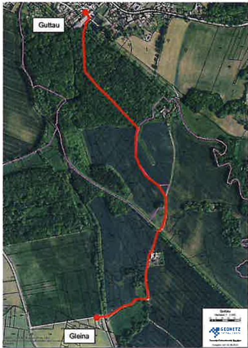
Wegführung zwischen Gleina und Guttau

Eine alternative Wegführung zwischen den Ortsteilen Gleina und Guttau ist bereits geprüft und soll über das Flurstück 585 Gemarkung Guttau geführt werden, so dass eine öffentliche Verbindung zwischen den Ortsteilen sichergestellt werden kann. Dies entspricht der ursprünglichen Route vor 1970 als historischer Kirchweg zwischen den Ortsteilen Gleina und Guttau. Das Flurstück 585 befindet sich im Eigentum der Gemeinde Malschwitz.